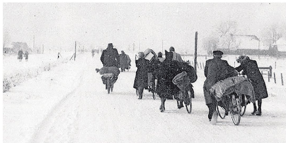
▲ Beelden uit de hongerwinter. Mensen uit vooral het westen van

■ Kapelaan in oorlogstijd wordt op 27 en 28 augustus gepresenteerd in Enschede en Utrecht. Belangstellenden kunnen nu al een exemplaar reserveren bij een van de historische kringen in Glanerbrug, Geesteren of Tubbergen of via de site kapelaaninoorlogstijd.nl.